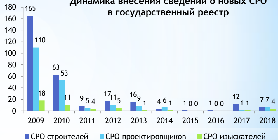
На 26.10.2018 из государственного реестра исключены сведения о 108 СРО